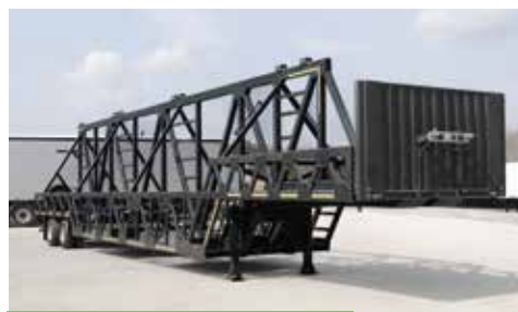
ПОЛУПРИЦЕПЫ ДЛЯ ПЕРЕВОЗКИ КРУПНОГАБАРИТНЫХ ШИН