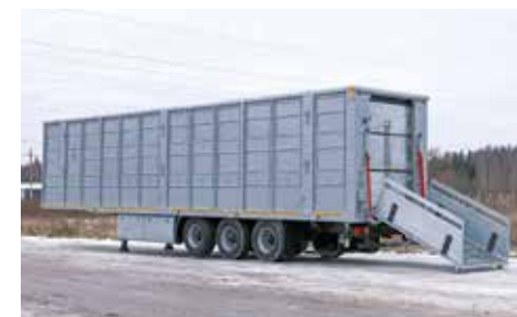
ПОЛУПРИЦЕПЫ ДЛЯ ПЕРЕВОЗКИ СКОТА И ПТИЦЫ