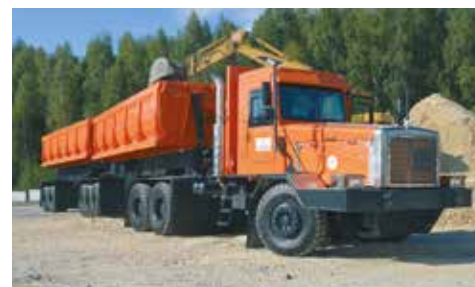
ВНЕДОРОЖНЫЕ ТЯГАЧИ И АВТОПОЕЗДА