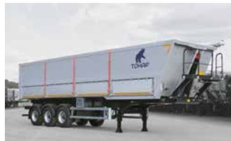
ЗЕРНОВОЗЫ И КАРТОФЕЛЕВОЗЫ