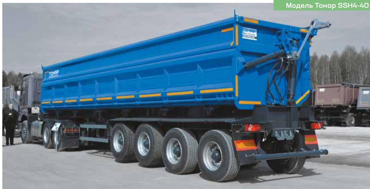
Модель Тонар SSH4-40