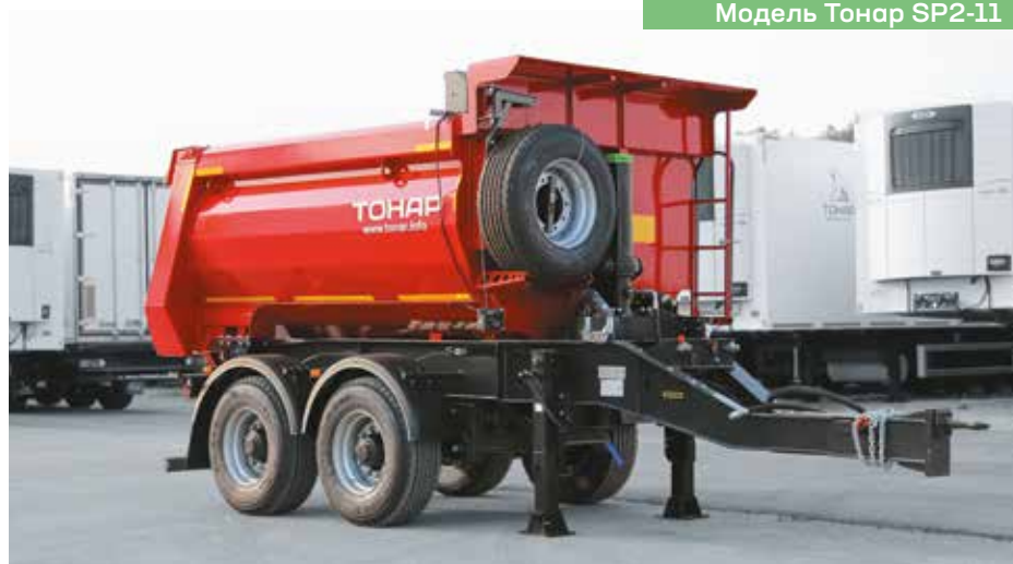
Модель Тонар SP2-11