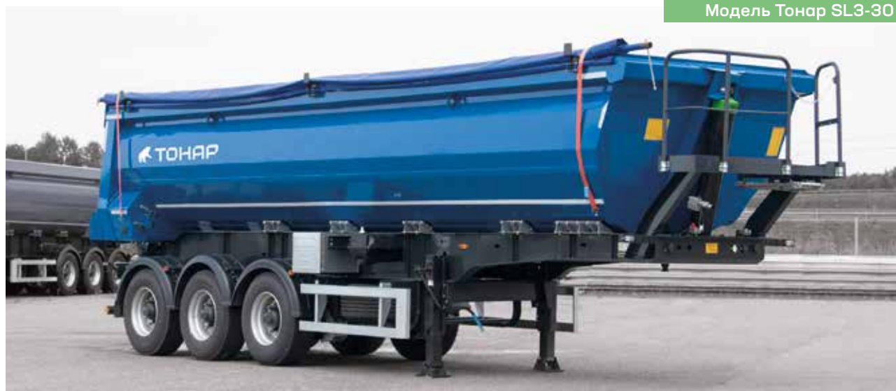
Модель Тонар SL3-30

Облегченная линейка самосвальных полуприцепов серии SL имеет в своей конструкции облегченные раму, кузов из высокопрочной стали и оси. Оси могут быть как с дисковыми, так и с барабанными тормозными механизмами.